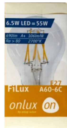
Onlux, LED Filux 6.5 Watt, 690 Lumen