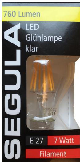
Segula, LED Glühlampe 7 Watt, 760 Lumen