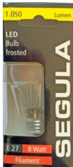
Segula, Filament LED Bulb 8 Watt, 1050 Lumen