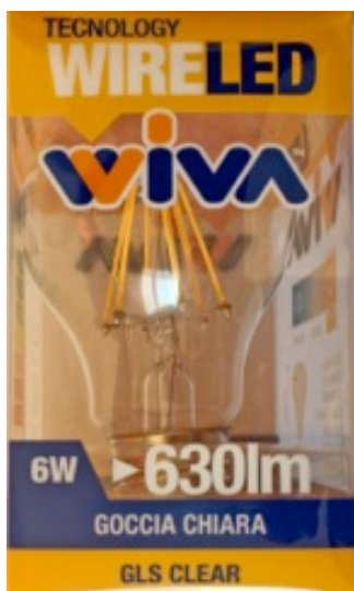
Viva, Wire LED 6 Watt, 630 Lumen