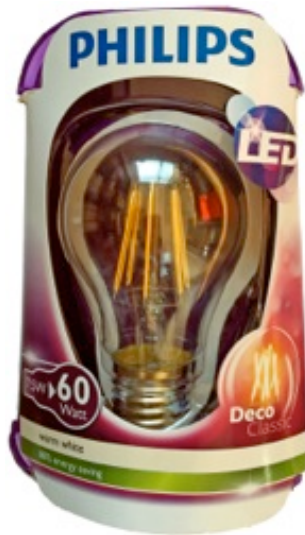
Philips, LED Deco Classic 7.5 Watt, 806 Lumen