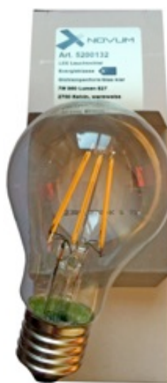
Xnovum, LCC Lamp 6.5 Watt, 960 Lumen